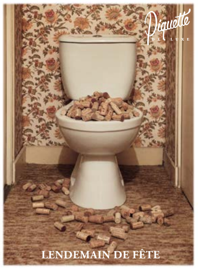
Carte postale + affiche tirage luxe