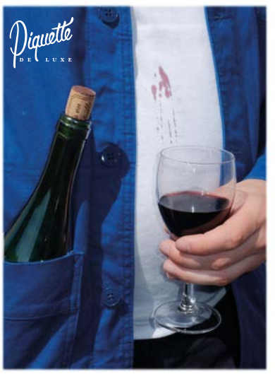
Carte postale + affiche tirage luxe