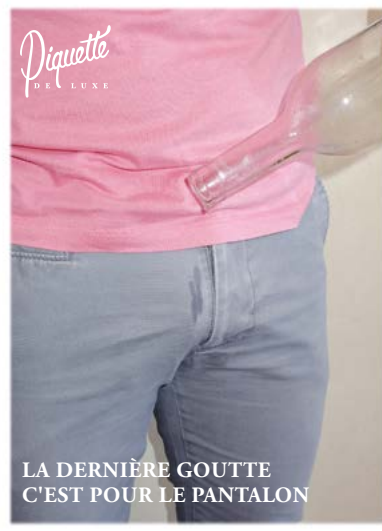
Carte postale + affiche tirage luxe