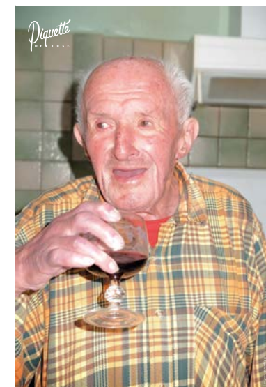
affiche tirage luxe

Carte postale : 2 Euros | Affiche tirage luxe : 15 Euros